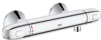
Grohtherm 1000 douchethermostaat