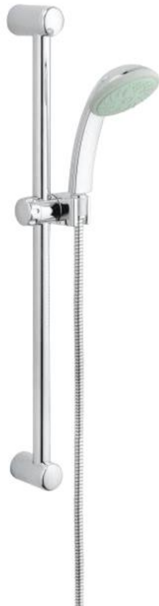
New Tempesta duo doucheset